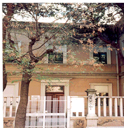
"Federico Fellini" Via Italica