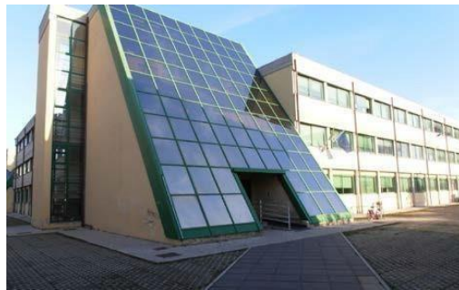
"Vittoria Colonna" Via Cerulli