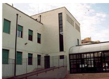
"Basilio Cascella" Piazza Di Grue