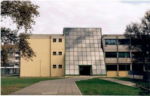
"Ilaria Alpi" Via Cerulli