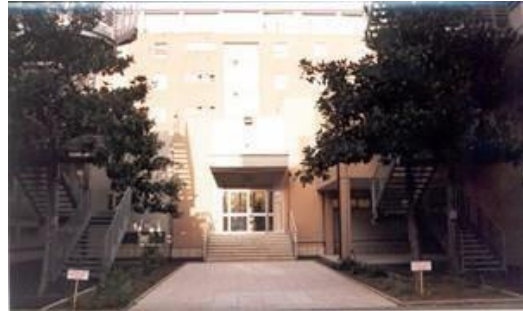
"Ennio Flaiano" Via Cecco Angiolieri