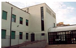
Piazza dei Grue